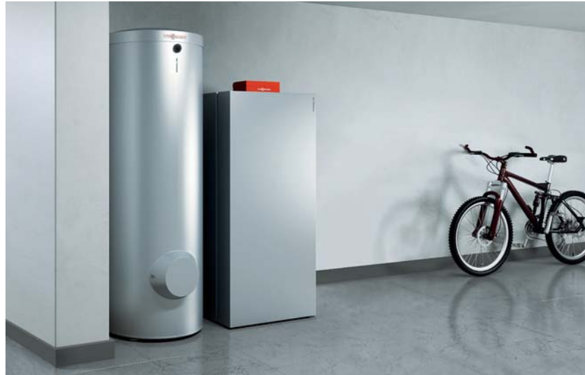
Gas-Brennwertkessel Vitocrossal 300 mit Warmwasserspeicher Vitocell (links)

Der Einsatz eines Brennwertkessels ist bei Neubauten schon fast selbstverständlich, da sich hier Heizkessel und Heizungsanlage von vornherein optimal aufeinander abstimmen lassen: Größten Nutzen bringt ein Brennwertkessel beim Einbau in Heizungsanlagen mit niedrigen Heizsystemtemperaturen. Selbst im Zuge einer Modernisierung lassen sich mittels Brennwerttechnik bis zu 30 Prozent der Heizkosten einsparen.