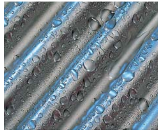
Inox-Crossal-Wärmetauscher aus Edelstahl

Fachbetrieb und Anwender profitieren gleichermaßen von der einfach zu bedienenden Vitotronic Regelung: Das Steuermenü ist logisch und leicht verständlich aufgebaut, beleuchtet, kontrastreich und leicht abzu-lesen. Eine Hilfefunktion informiert im Zweifelsfall über weitere Eingabeschritte. Die grafische Bedienoberfläche dient auch zur Anzeige von Heizkennlinien und Solarertrag.