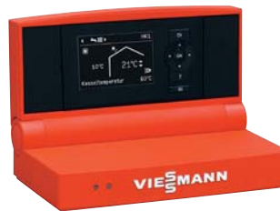
Vitotronic 200 Regelung mit übersichtlicher Menüführung